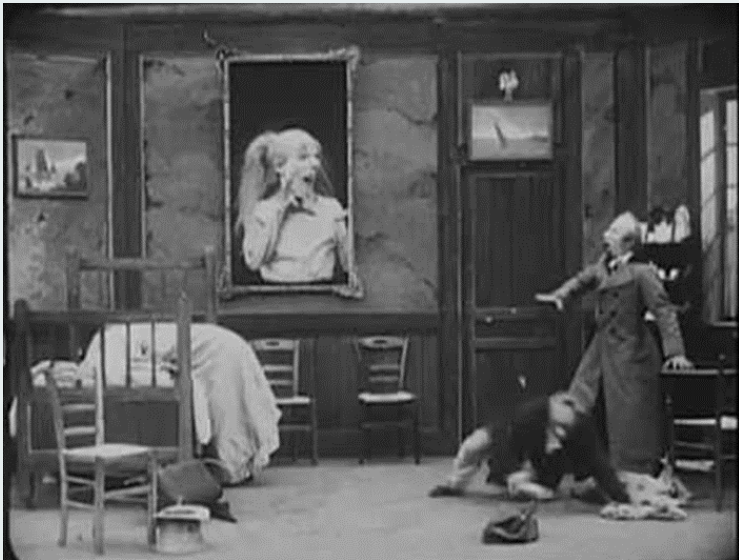
Fotogramas de A Casa Assombrada , Segundo de Chomón, 1908