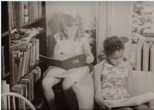
Fotograma de Portrait of a Library

Burger, Hanuš, Wexler, S., Quigley, M. C., Montclair Public Library & Museum Of Modern Art. Film Library. (1940) Portrait of a Library . [United States: Museum of Modern Art Film Library] [Video] Retrieved from the Library of Congress.