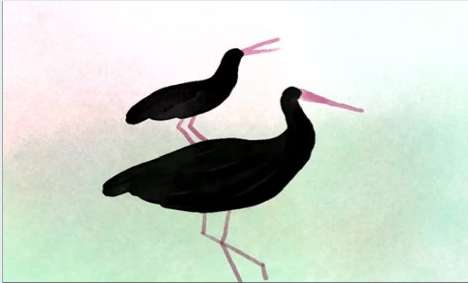
Fotograma de Cegonhas Pretas