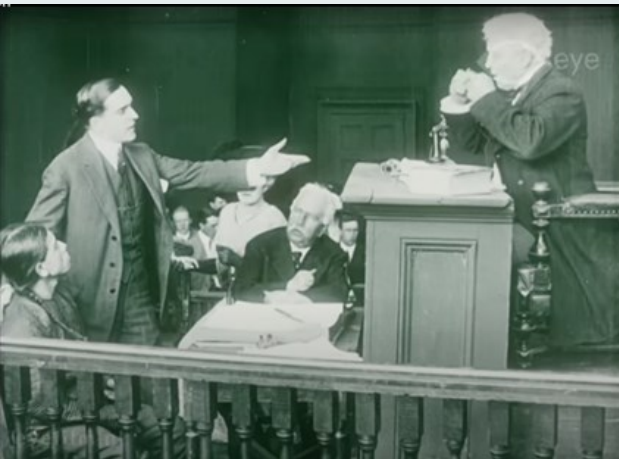
Fotograma de Father and Son (1912)

O Museu de Cinema da Holanda disponibiliza diversos recursos fílmicos, com versões de qualidade no seu canal no Youtube (EYE FILM MUSEUM). Aqui deixamos o link para diversos títulos dos primórdios da História do Cinema, como é o caso do curioso filme Pai e Filho/Father and Son , de 1912, com cerca de 15 minutos, da Vitagraph Company of America (Verenigde Staten). Desde os primórdios da sua história, as questões de ordem moral sempre interessaram às narrativas construídas pela arte do cinema e, neste caso, trata-se de um pequeno melodrama que proclama o valor dos afetos e da justiça. Sang Lee, um homem de origem chinesa, tem pena de um órfão, e adota-o. Vinte anos mais tarde, o filho adotado, Jack, transforma-se num advogado importante, e vai ter de defender o seu pai adotivo de uma falsa acusação em tribunal.