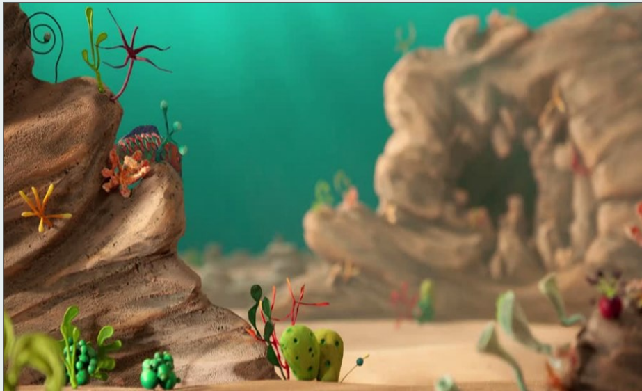
Fotograma de Peixes-Papagaio , © RTP ZIG ZAG