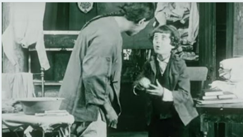
Fotograma de Father and Son (1912)