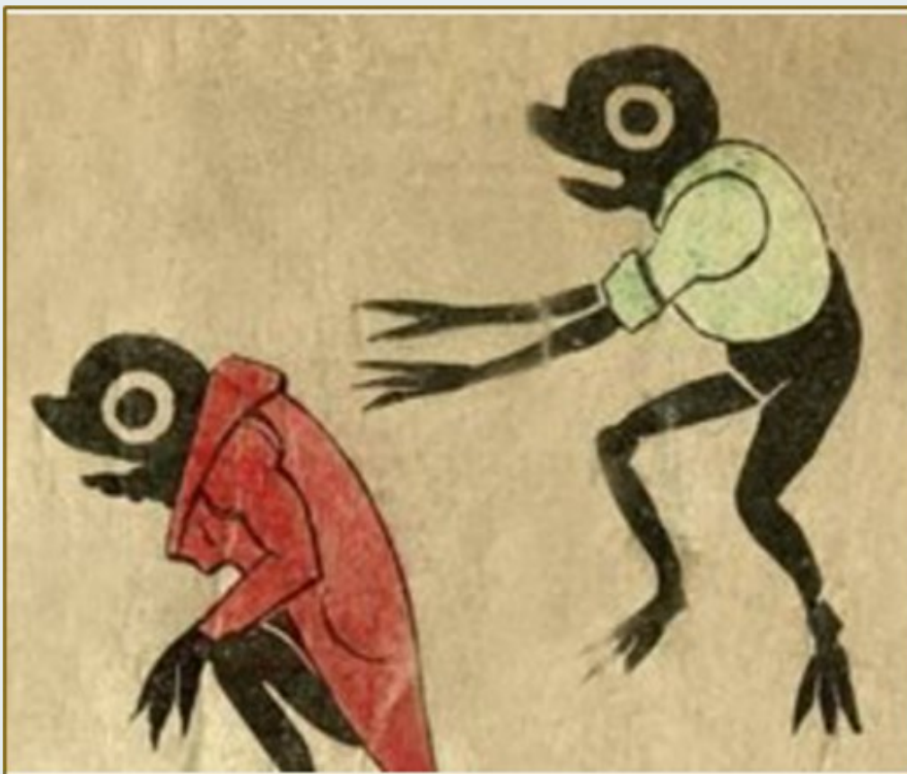
Imagens: Jogo do Taumatrópio | M.D - Mauclair-Dacier, França, 1900 ca. e Zootrópio | The London Stereoscopic & Photographic Company (atr.), Londres, 1870 ca.