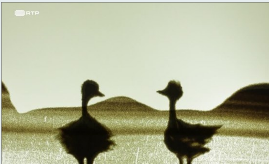
Fotograma de Avestruzes