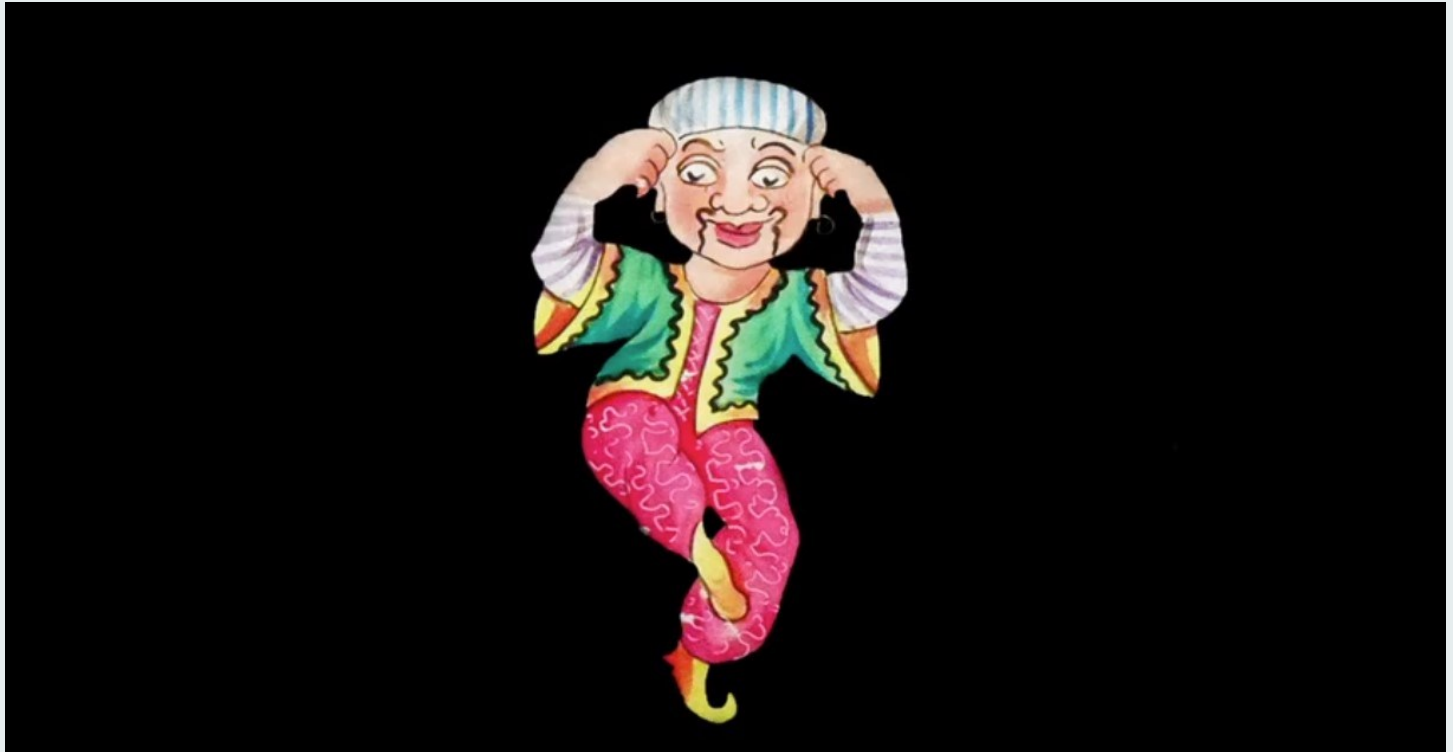
Fotograma de Vidro para Lanterna Mágica, Animado, de pega com máscaras, Magia do Chinês, Autor n/ident. Reino Unido, 1860 ca, Col. CP-MC

Proseguindo objetivo de valorizar a fruição cinematográfica como ato de cultura, neste número de novembro, o PNC continua a divulgar junto das comunidades educativas um conjunto de recursos fílmicos provenientes de plataformas públicas, com destaque para os extraordinários acervos de arquivos fílmicos internacionais e de outras coleções de grande impacto cultural, como a da Biblioteca do Congresso dos EUA. Contemplando as vertentes da animação, ficção e documentário, e cumprindo a missão de formar públicos escolares para o cinema e audiovisual, é importante valorizar e dar a conhecer este património às comunidades educativas. Além destes recursos, o PNC sugere e disponibiliza recursos de filmes feitos por e/ou para crianças, de cinema que dialoga com a História e com direitos humanos, que promove a relação com o Outro e com o Mundo, e que promove o diálogo com temas de sustentabilidade.