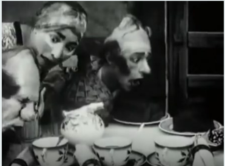
Fotogramas de A Casa Assombrada, Segundo de Chomón , 1908