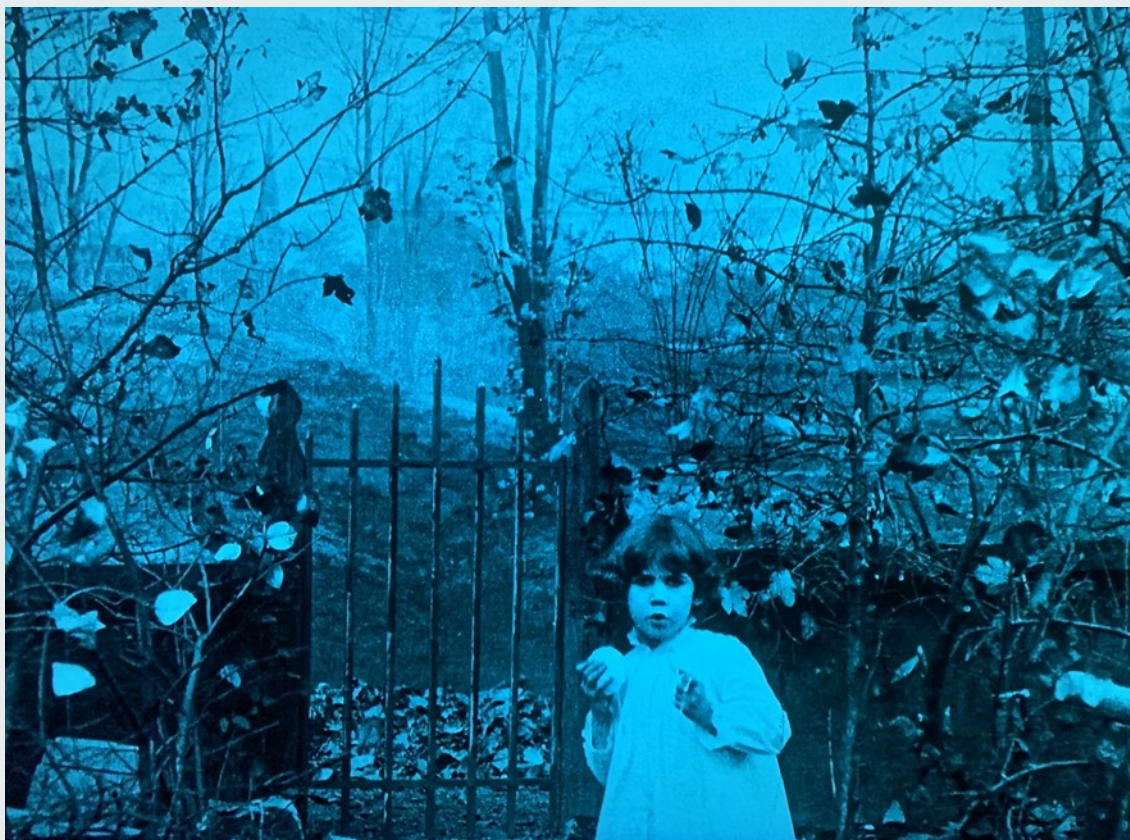
Fotograma de Falling Leaves (1912), Alice Guy-Blaché.