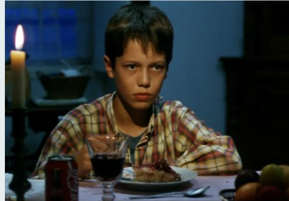
Fotogramas de O Garoto de Charlot (Charles Chaplin), Ladrões de Bicicletas (Vittorio de Sica), Encontros Imediatos do 3.º Grau (Steven Spielberg), Entrevista com o Vampiro (Neil Jordan) Aniki Bó-bo (Manoel de Oliveira) e Adeus, Pai (Luís Filipe Rocha)