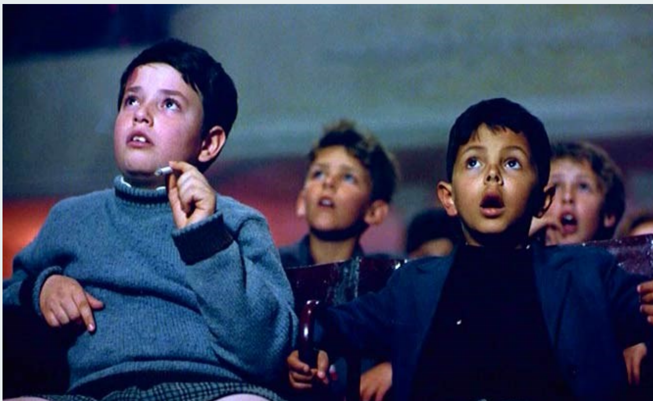
Fotogramas de Cinema Paraíso (1988), Giuseppe Tornatore

O PNC deseja a todas as comunidades educativas um ótimo DIA MUNDIAL DA CRIANÇA!